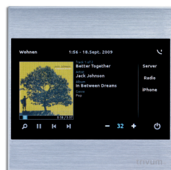
trivum TouchPad (optional)